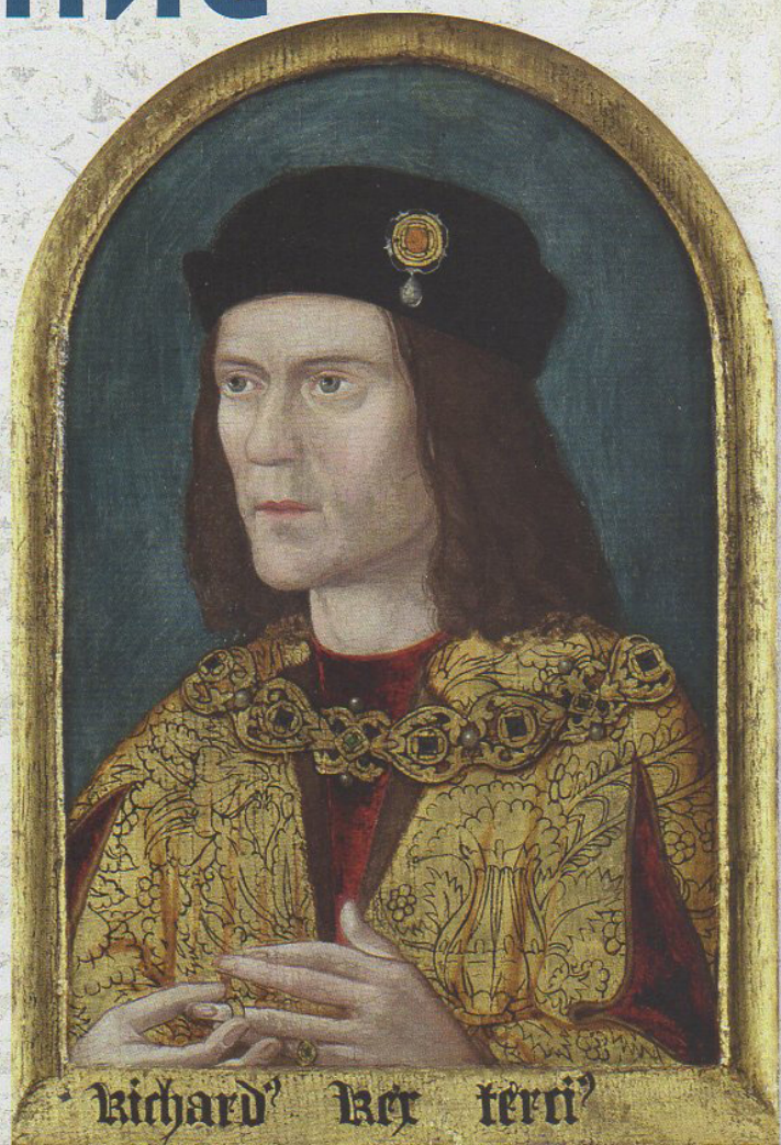
▲ Портрет Ричарда III, 1520-е годы