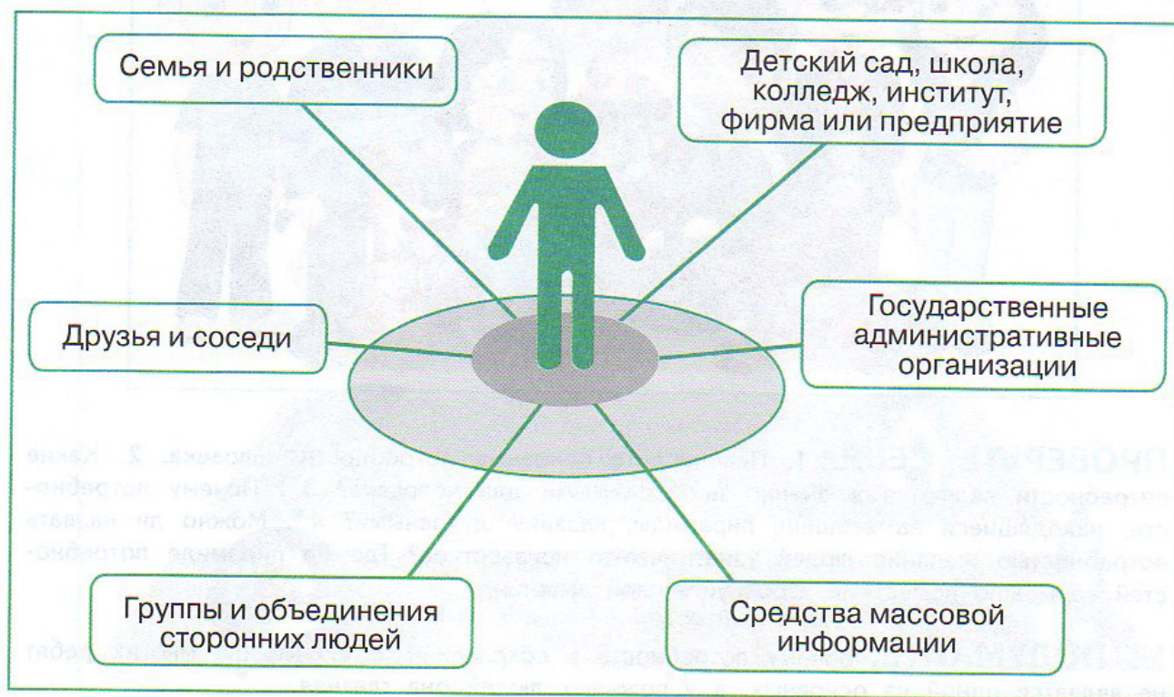
Рис. 15.4. Средства социальных технологий

Средства таких технологий определяются имеющимися ресурсами и их предназначением (рис. 15.4). Методы социальных технологий согласуются с целями воздействия, личностными особенностями людей и их потребностями.